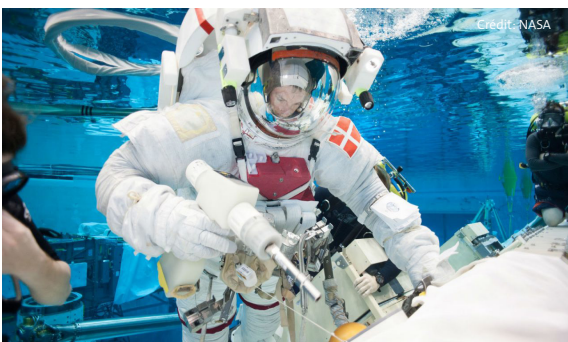
↑ L'astronaute de l'ESA Andreas Mogensen s'entraîne aux sorties dans l'espace au Neutral Buoyancy Laboratory de la NASA à Houston, aux États-Unis.

Lorsqu'ils assemblent ou entretiennent des objets dans l'espace, les astronautes doivent faire preuve d'une bonne dextérité et d'une bonne coordination œil-main et travailler en équipe. Ils doivent également être capables de manipuler des outils et des objets tout en portant une combinaison spatiale pressurisée avec des gants sur les mains. Ces gants, portés pour protéger les astronautes de l'environnement spatial, peuvent être épais et encombrants. Ils sont conçus pour que les astronautes en EVA puissent bouger leurs doigts aussi facilement que possible. Ils doivent apprendre à travailler avec leurs gants pour manipuler des objets petits et grands.